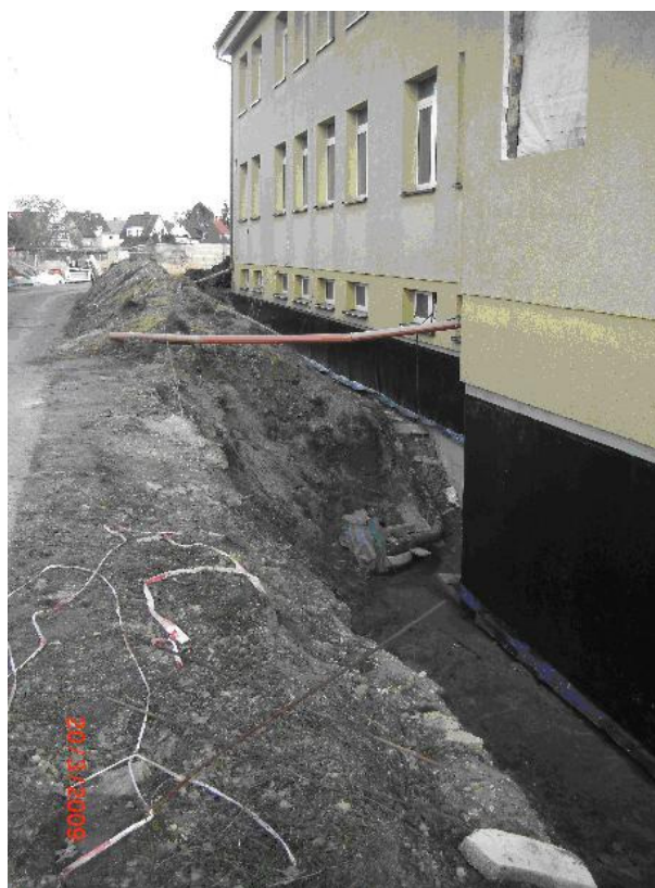
Färdig tätning utomhus, utan isolering