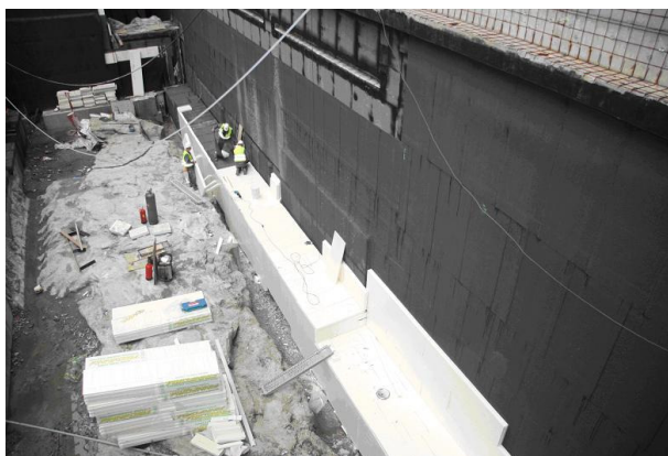
Tätningen skyddas genom isolering