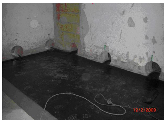
Färdig tätning med 2 mm PVC (inomhus)